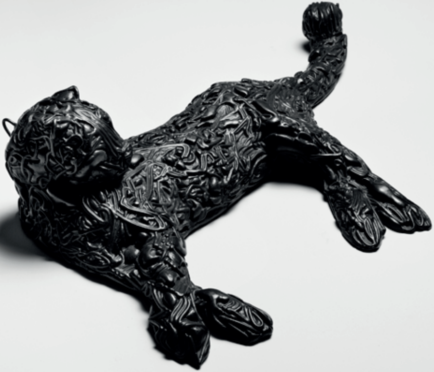
LEVHART 2011 – 2018, bronz, 14 × 51 × 31 cm