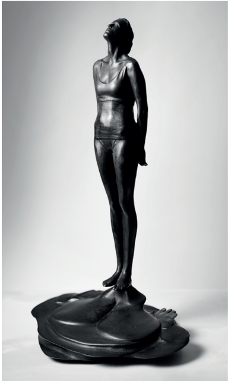
STÍN 2020, bronz, 38 × 23 × 19 cm