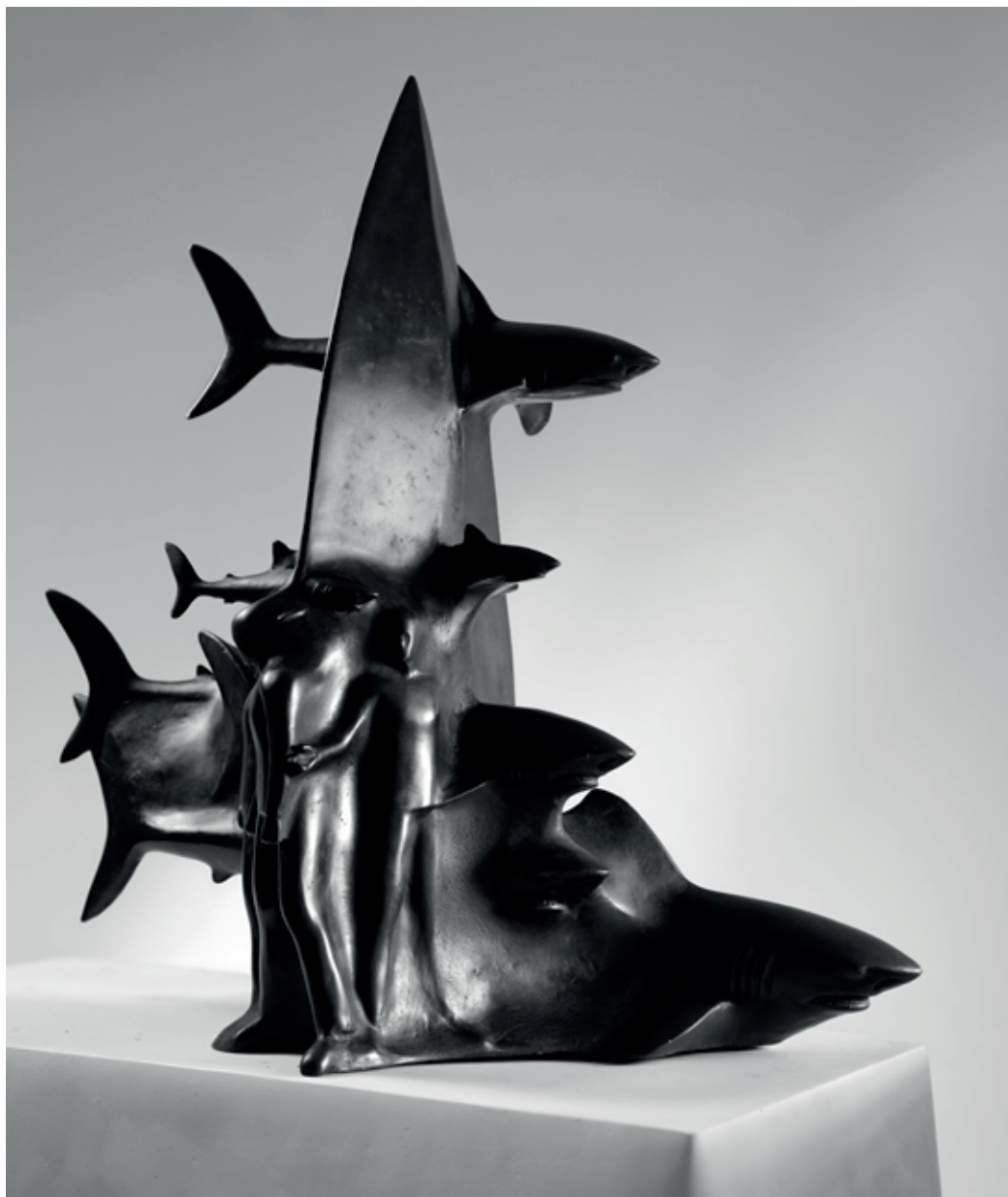
ROZHRANÍ 2009, bronz, 45 × 44 × 24 cm