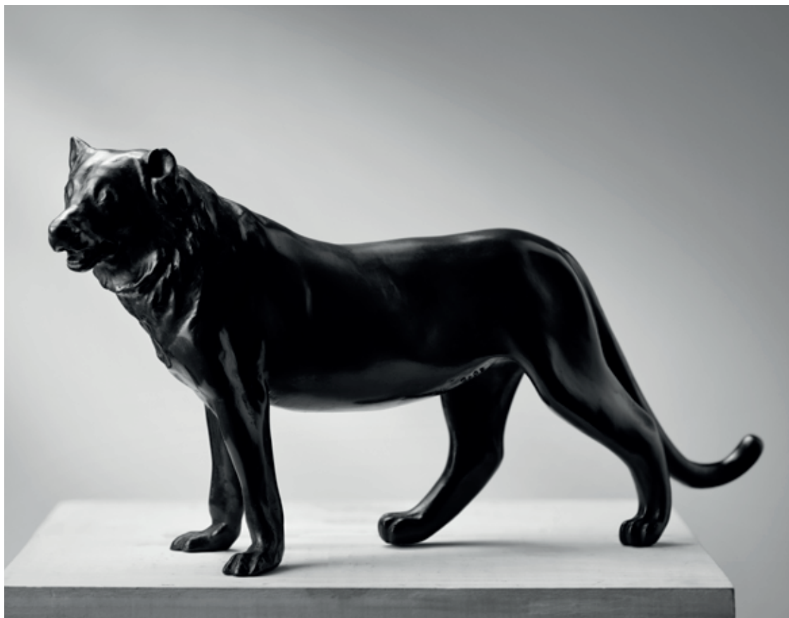
KOČKOPES 2016, bronz, 22 × 40 × 10 cm