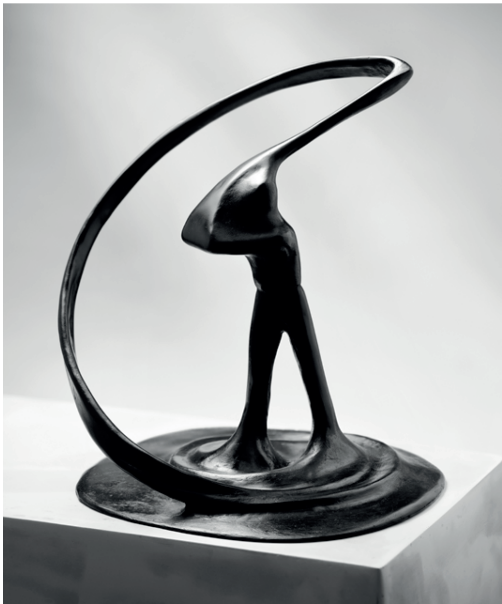
GOLFISTA 2017 – 2022, bronz, 30 × 26,5 × 24,5 cm