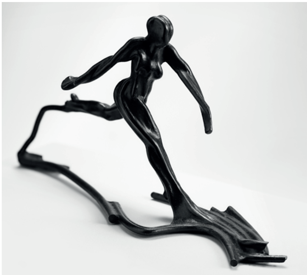
BĚH V LINÍCH I. 2011 – 2022, bronz, 23 × 44 × 14 cm