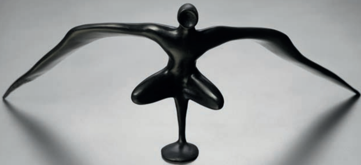
ZÁPADNÍ ARCHANDĚL 2018, bronz, 15 × 37 × 13 cm