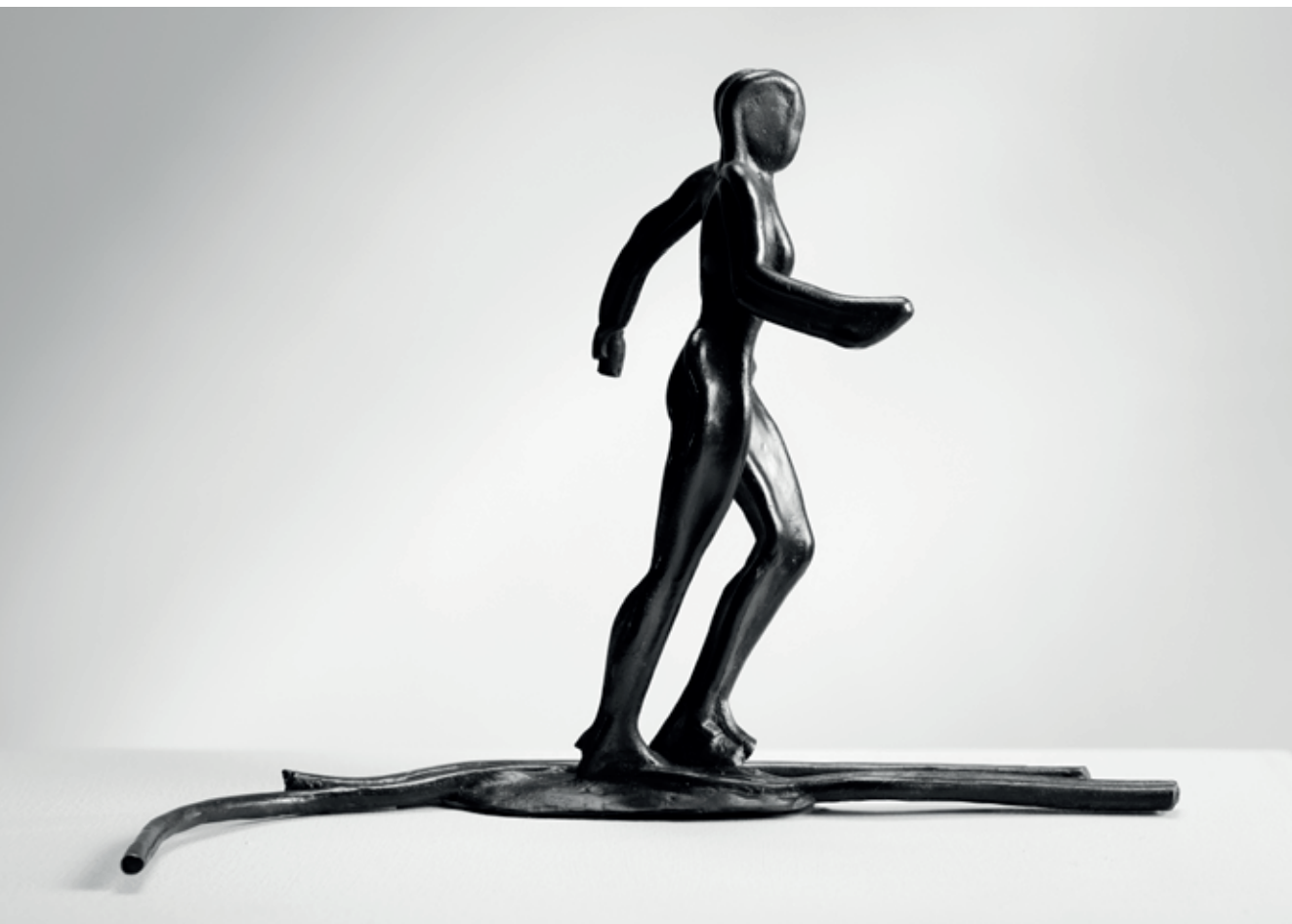
BĚH V LINÍCH II. 2011 – 2022, bronz, 23 × 33 cm