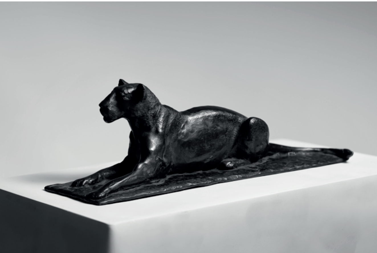
LVICE 2018 – 2022, bronz, 13 × 41 × 12 cm