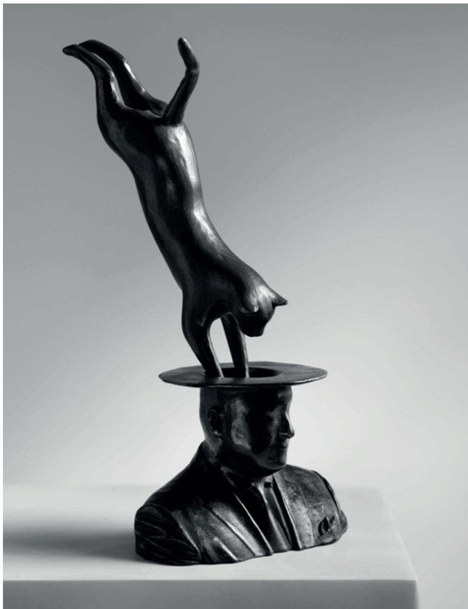
KOCOUR 2022, bronz, 33 × 15 × 12 cm