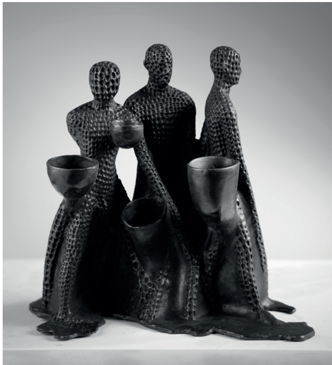
NOSIČI 2009, bronz, 25 × 25 × 13 cm