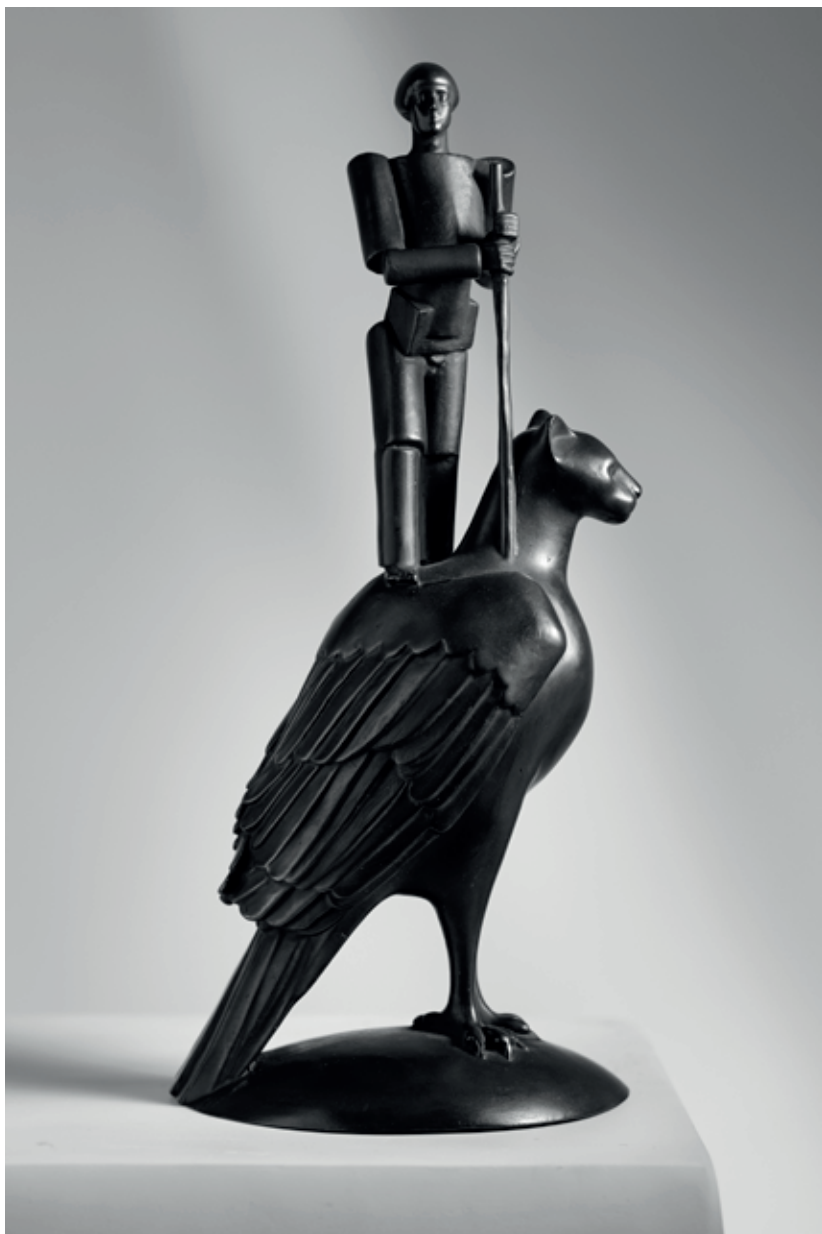
PŘEVOZNÍK DO RÁJE 2007, bronz, 35,5 × 15,6 × 13 cm