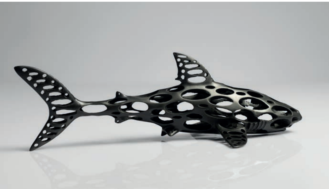
PARYBA 2010, bronz, 13 × 42 × 18,5 cm