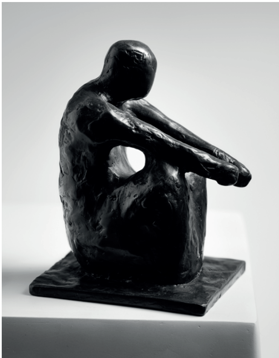
VESLAŘ 1983, bronz, 17 × 12 × 11 cm