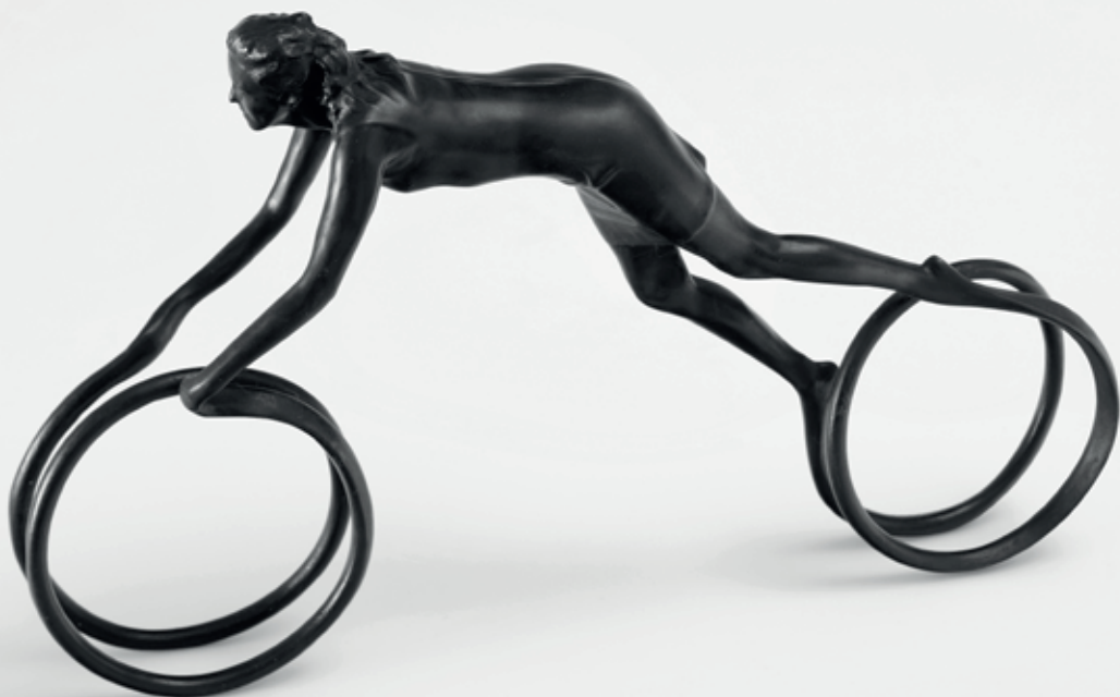
LU 2014, bronz, 24 × 40 × 7 cm