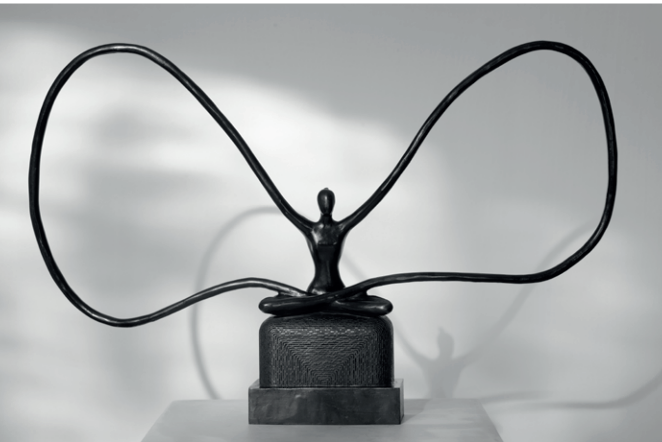
POZICE MOTÝLA 2017 – 2022, bronz, 30 × 47 × 6,5 cm