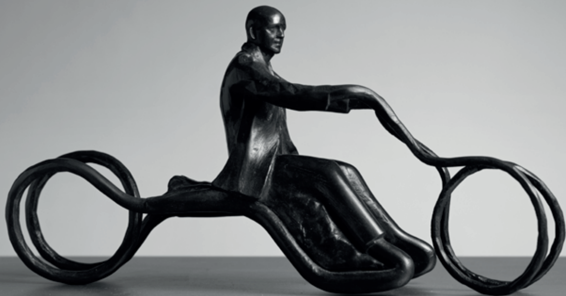
PŘELUD 2019 – 2022, bronz, 20 × 35 × 10 cm