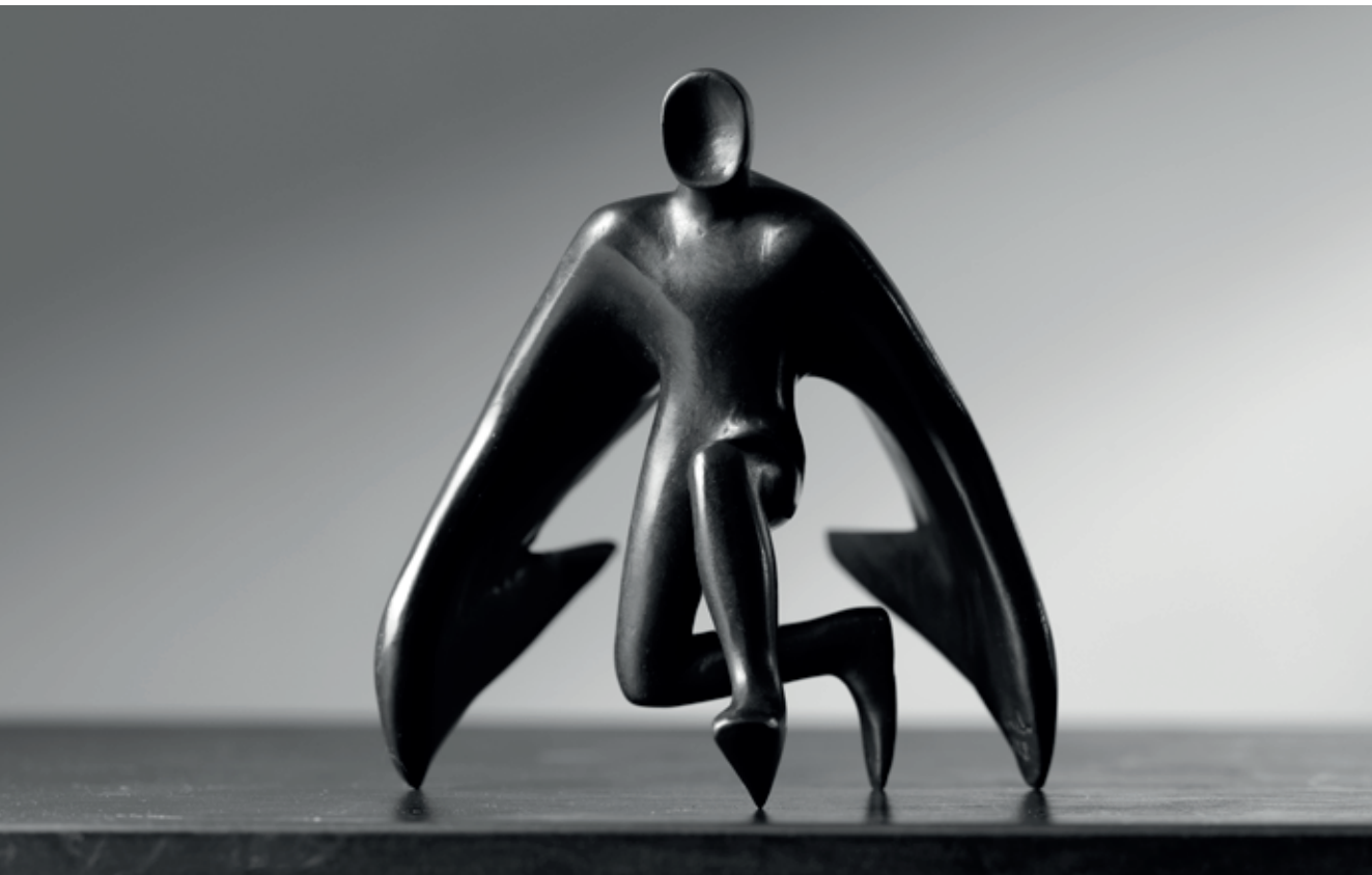
VÝCHODNÍ ARCHANDĚL 2018, bronz, 14,5 × 17 × 14 cm