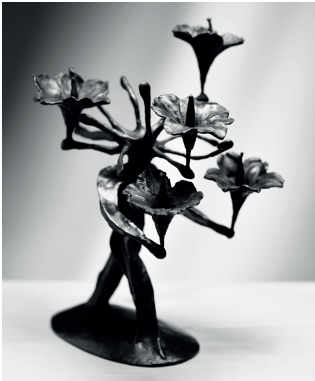
KVĚTONOŠ 2000 – 2022, bronz, 29 × 28 × 19 cm