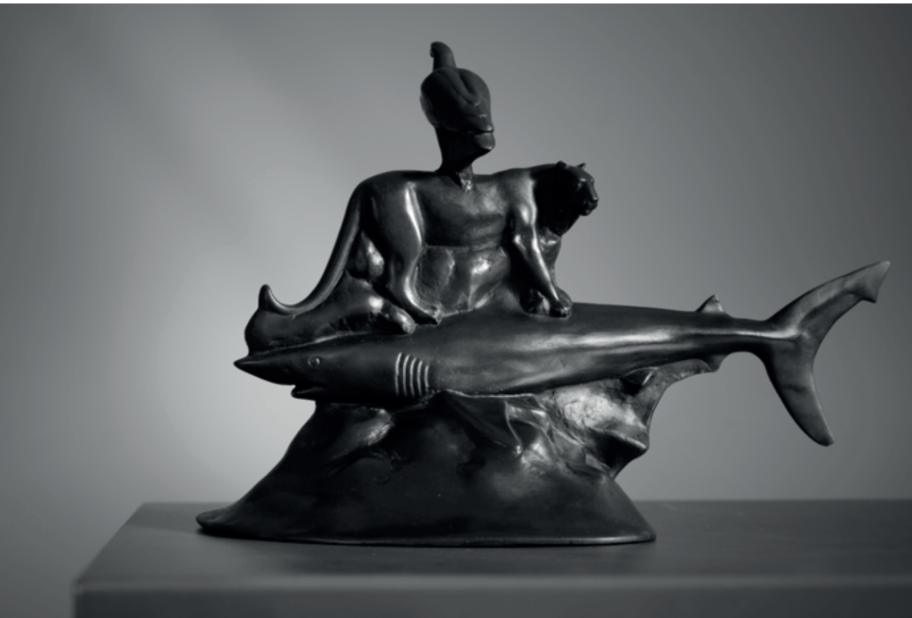
VODA, ZEMĚ, VZDUCH 2011, bronz, 24 × 38 × 20 cm