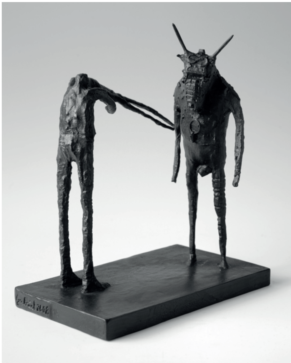
SETKÁNÍ Z OSMDESÁTÝCH LET 2008, bronz, 20 × 17 × 10 cm