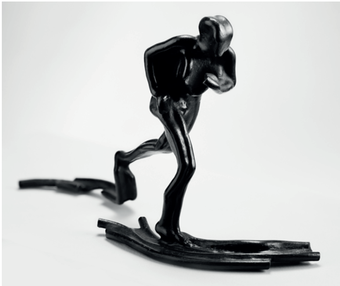
BĚH V LINÍCH IV. 2011 – 2022, bronz, 21,5 × 34,5 × 10 cm