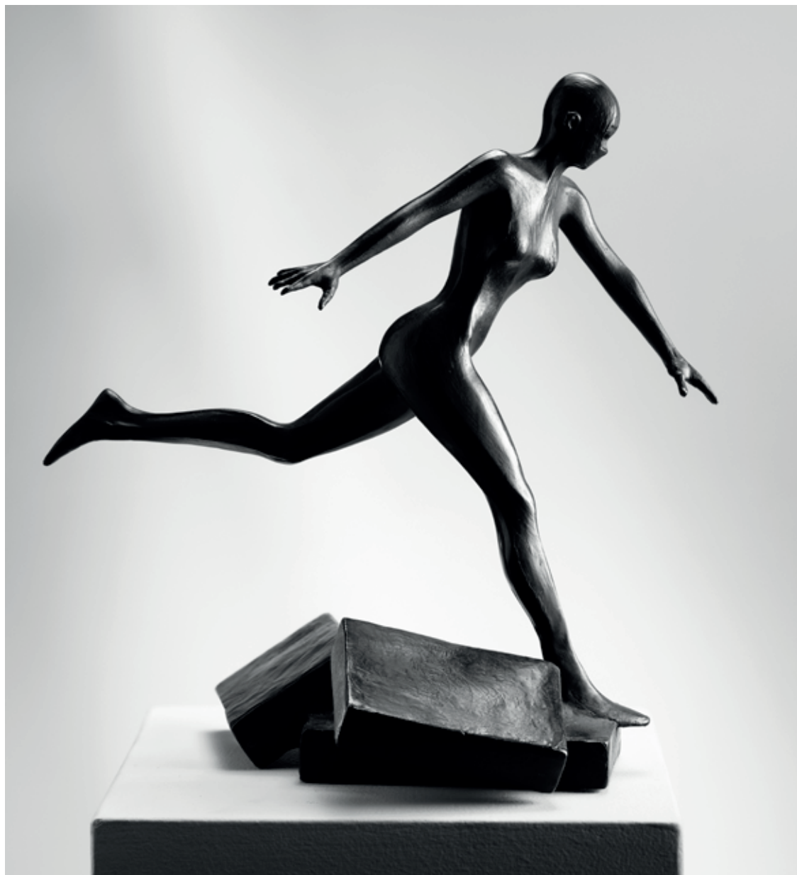
INKOGNITO 2010, bronz, 33 × 30 × 29 cm