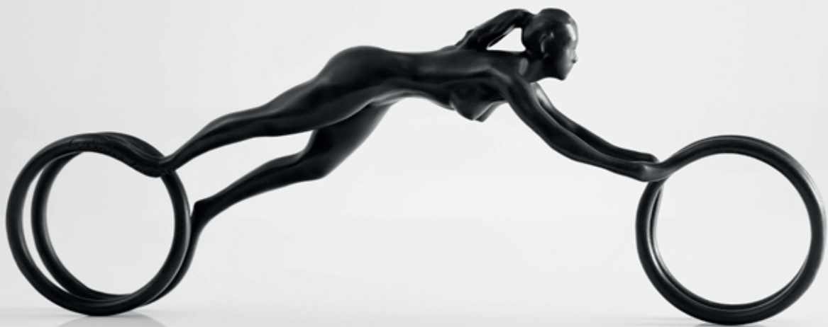
ESTER 2014, bronz, 15 × 39 × 6 cm