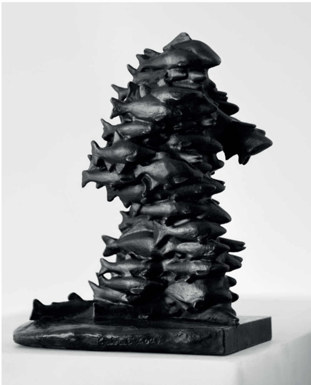
RYBÁŘ 2008, bronz, 20 × 15 × 10 cm