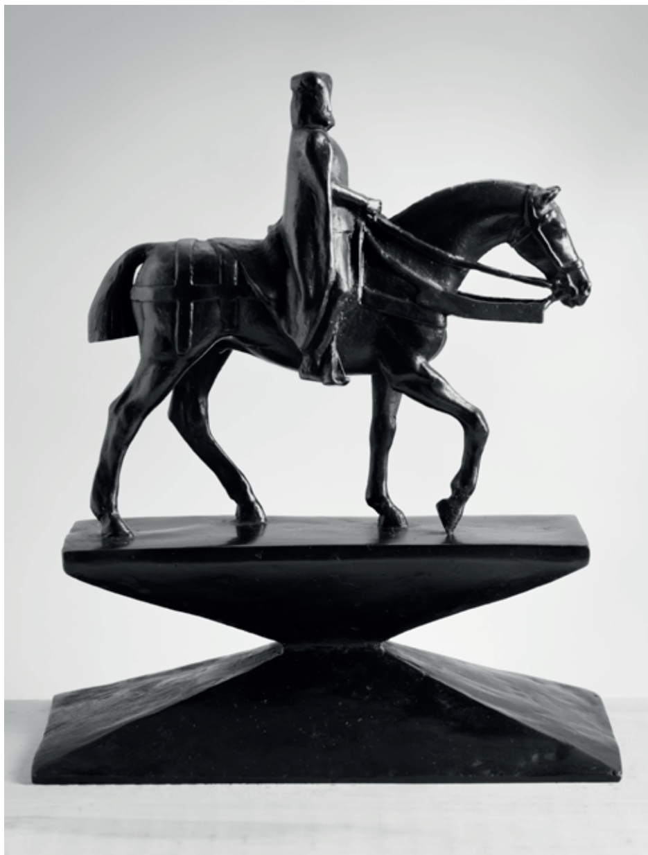
KAREL IV. SKICA 1 2017, bronz, 24 × 20 × 1,5 cm