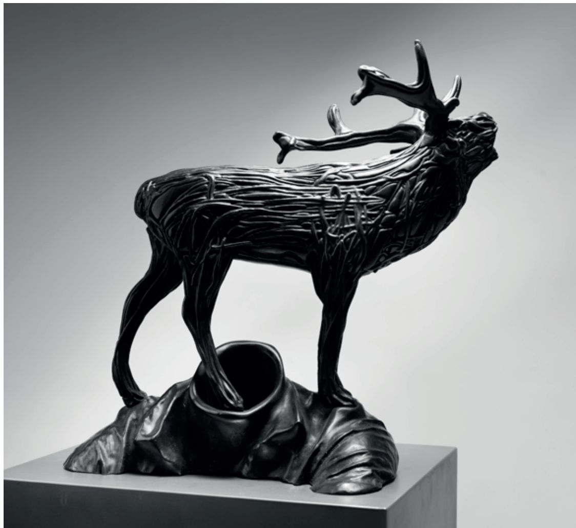
JELEN 2015 – 2021, bronz, 52 × 52 × 25 cm