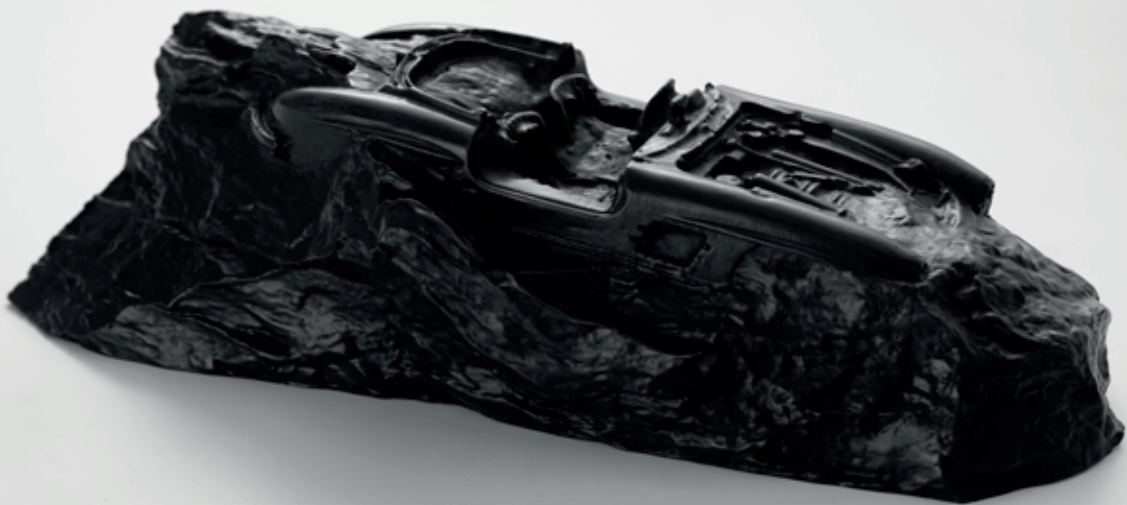
FOSILIE 2022, bronz, 11 × 38 × 13,5 cm