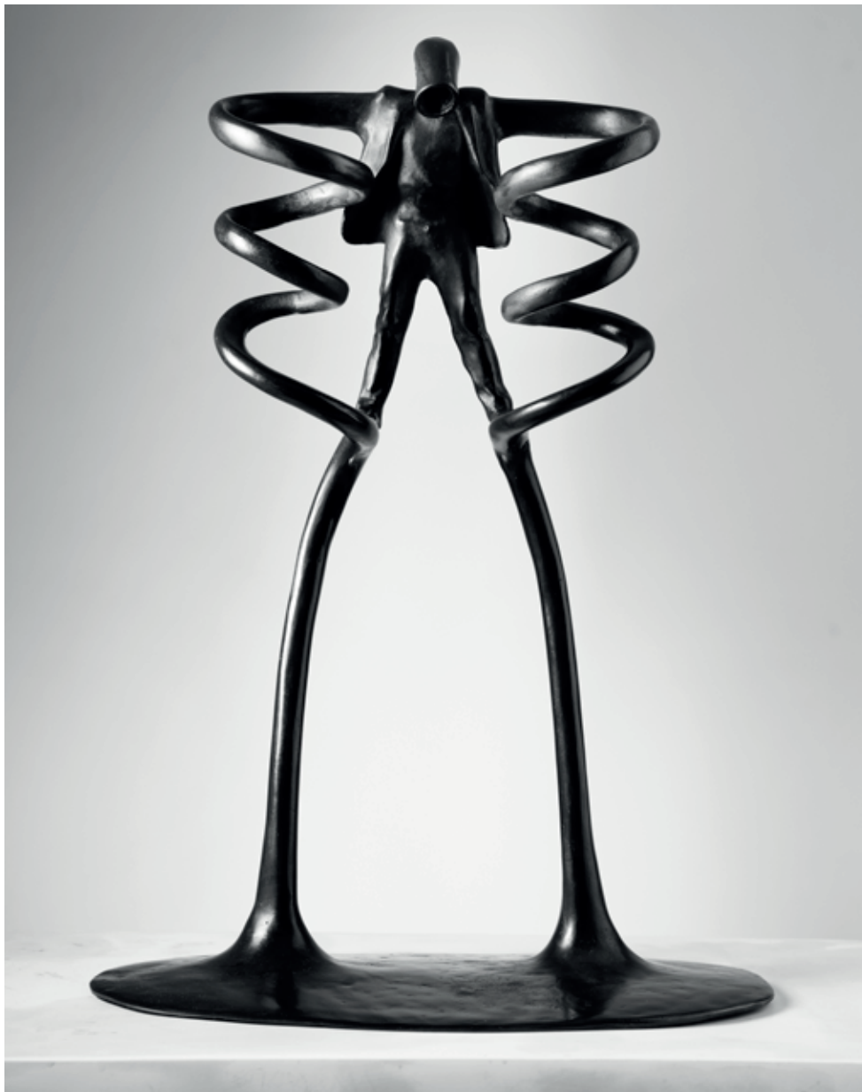
SPIRÁLOVÝ ŽEBŘÍK 3 2015, bronz, 46 × 33 × 15,5 cm