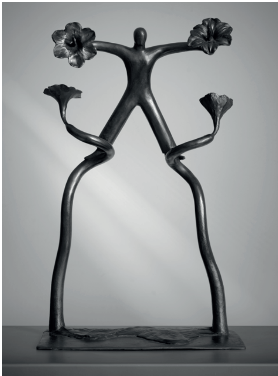
ZAHRADNÍK (KVĚTINOVÁ FIGURA) 2015, bronz, 53 × 34 × 21 cm