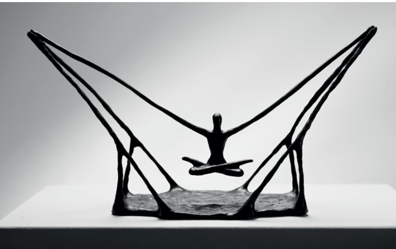
LOVEC MRAKŮ 2018, bronz, 38 × 27 × 14 cm