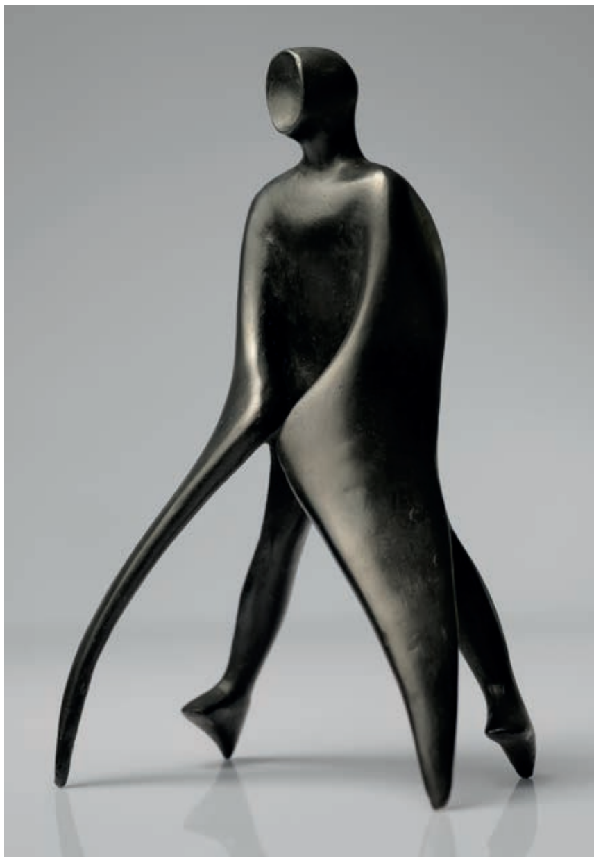
SEVERNÍ ARCHANDĚL 2018, bronz, 21,5 × 13 × 8,5 cm