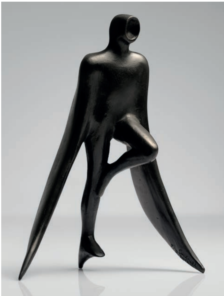
JIŽNÍ ARCHANDĚL 2018, bronz, 21 × 15 × 10 cm