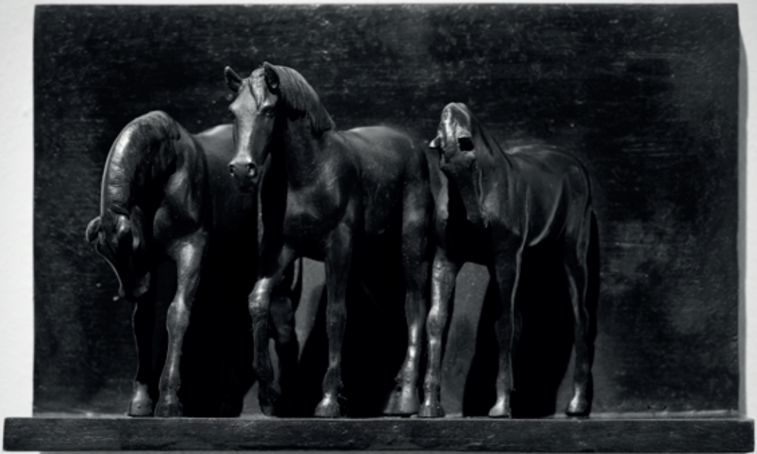
TROJICE 2023, bronz, 12,5 × 20 × 8 cm