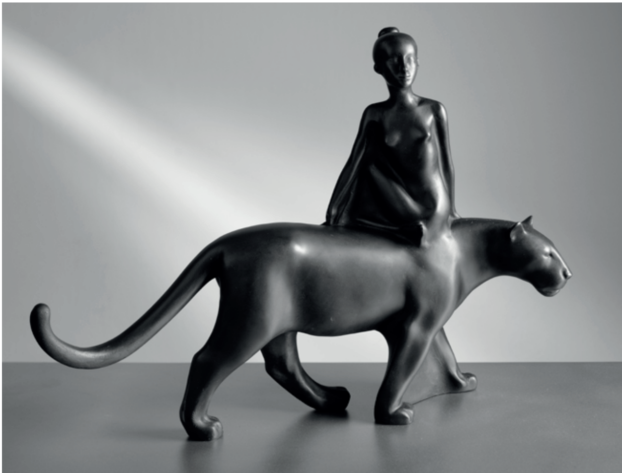
NA VELKÉ KOČCE ZPRAVA 2008 – 2021, bronz, 32 × 43 × 9 cm