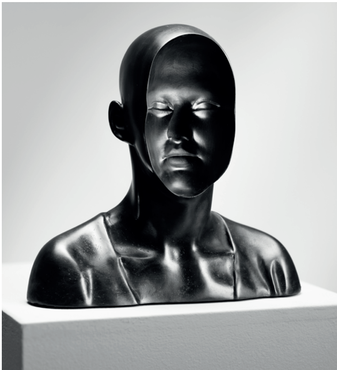
RUB TVÁŘE 2010, bronz, 20 × 21 × 8 cm