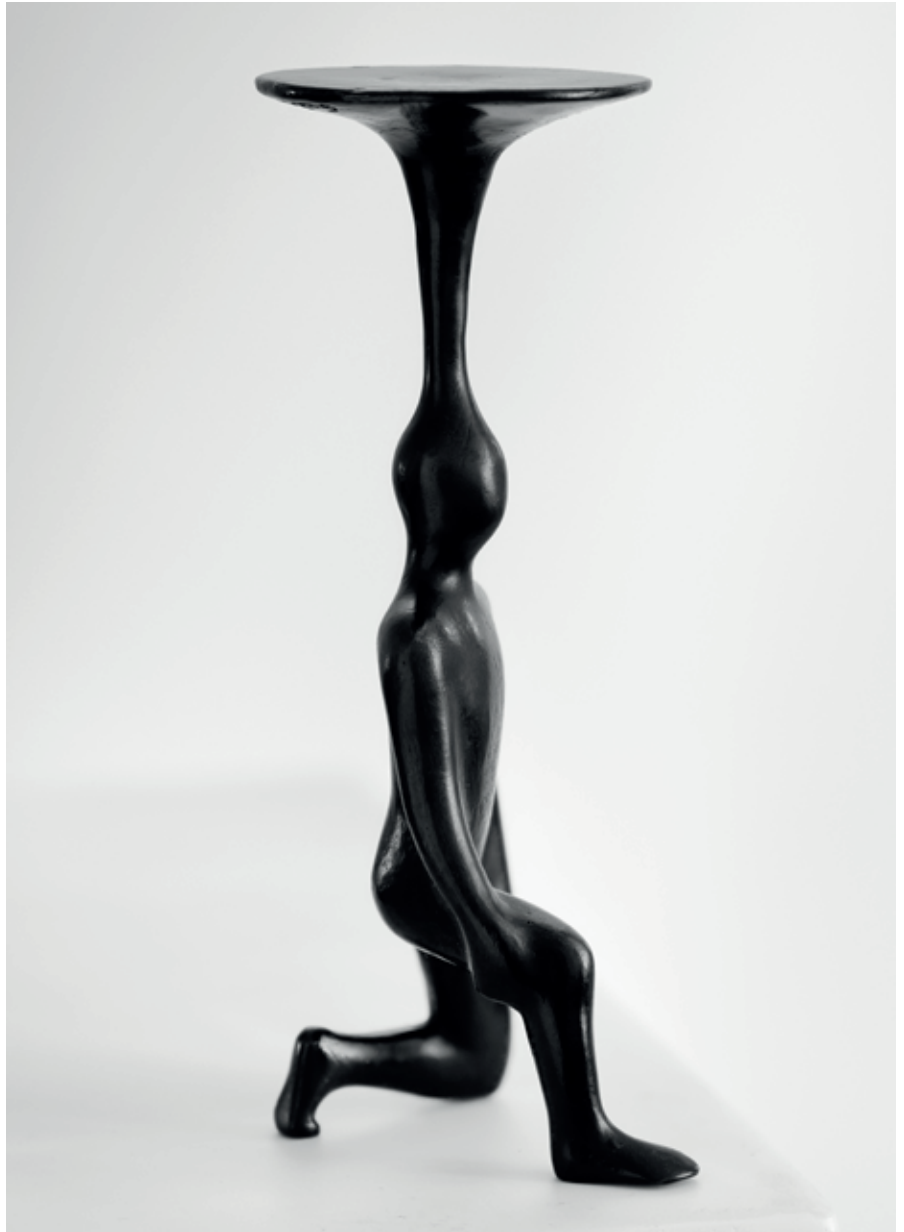
POSEL 2007, bronz, 28 × 10 × 10 cm