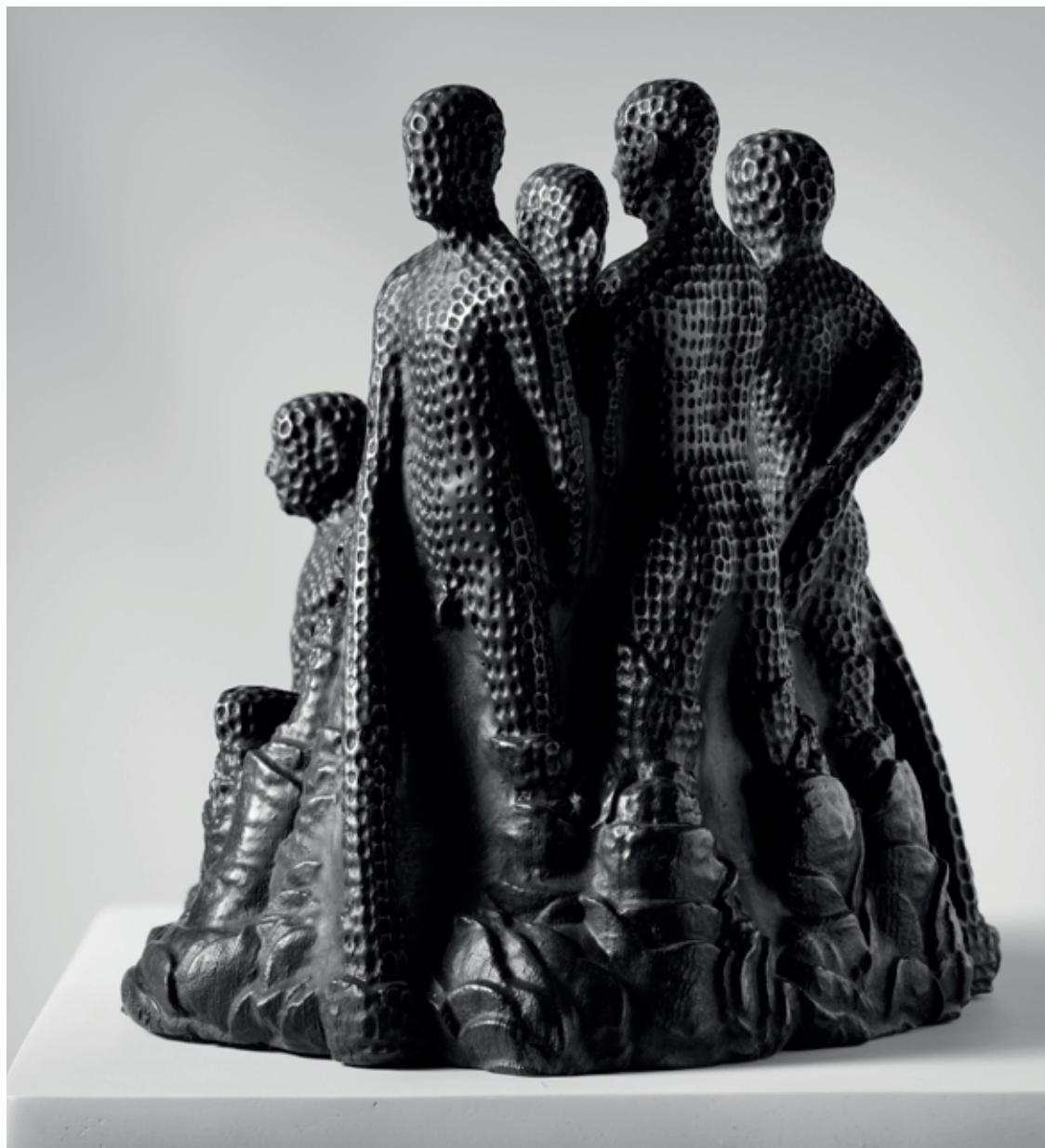
HLÍDKA 2009, bronz, 22 × 21 × 19 cm