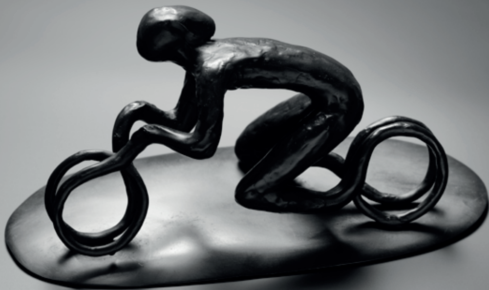
RYCHLÝ JEZDEC – „ZÁVODNÍK“ skica k prvnímu apokalyptickému jezdcí, 2015, bronz, 15 × 31,5 × 13 cm