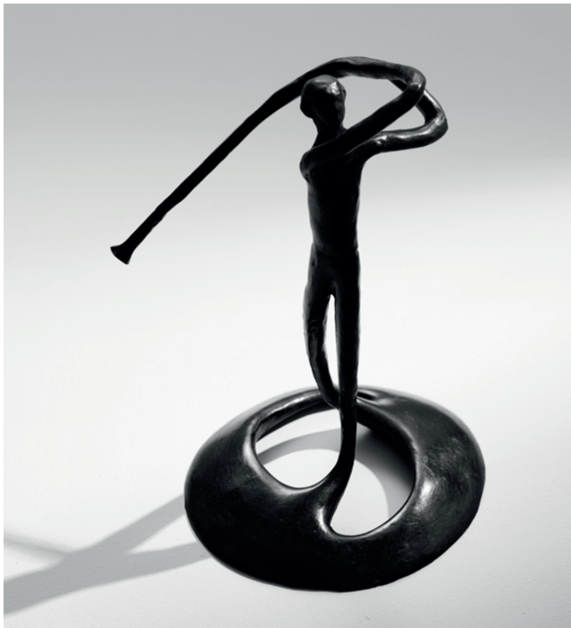
GOLFISTA – ODPAL 2016 – 2022, bronz, 21 × 12,5 × 14,5 cm