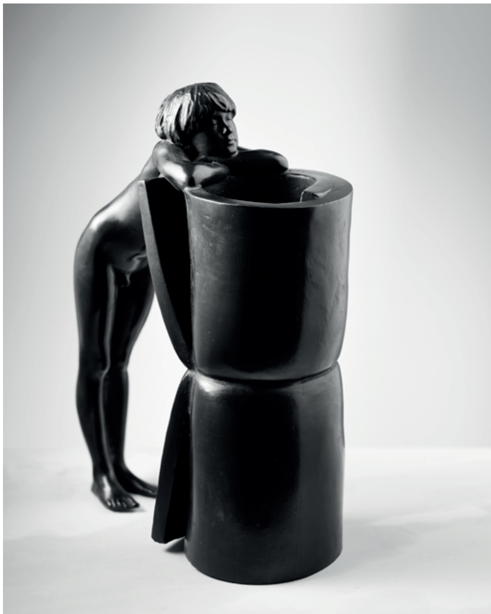
POZOROVATELNA 2021, bronz, 24,5 × 18 × 9 cm