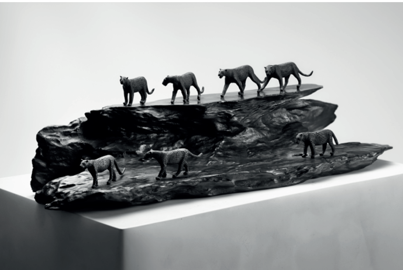
SMEČKA NA SKÁLE 2022, bronz, 14 × 54 × 13 cm