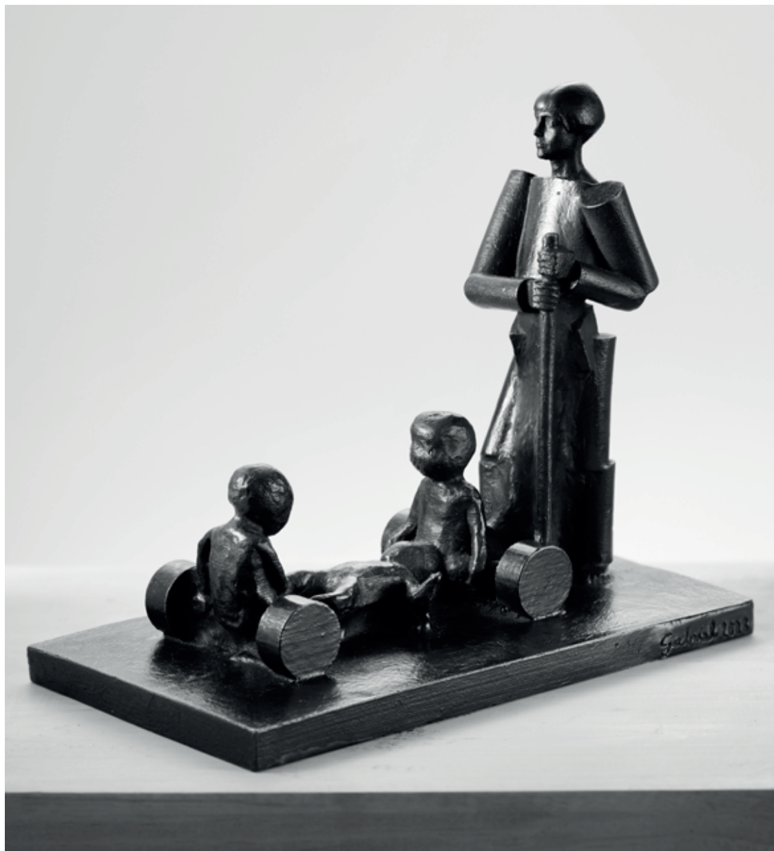
DĚTSKÝ VOZÍK 2008, bronz, 20 × 23 × 13,5 cm