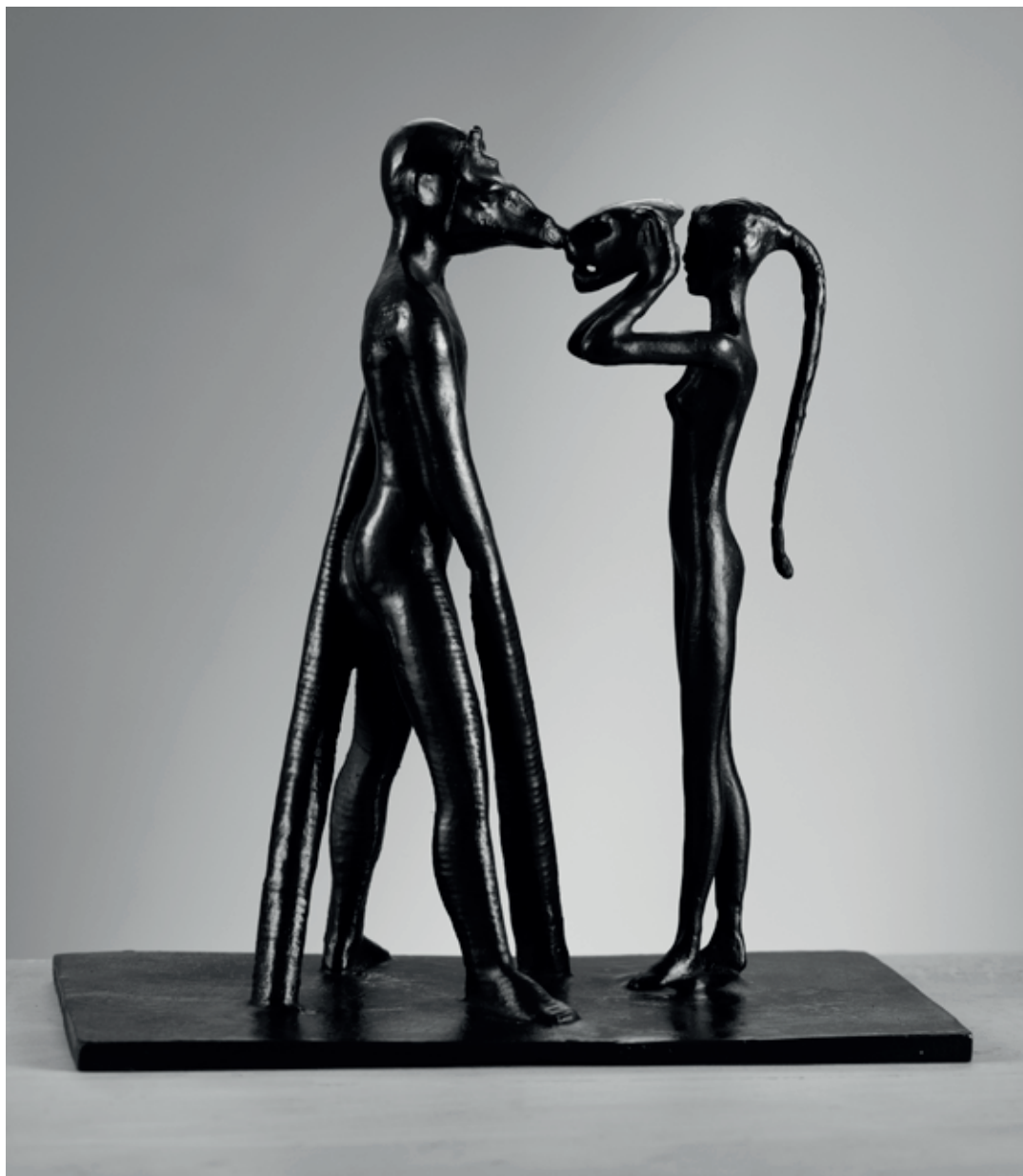
MASKY 2008, bronz, 20 × 18,5 × 10 cm