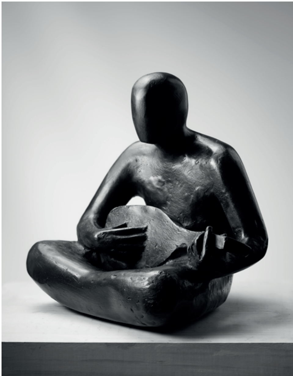
LOUTNISTA 1983, bronz, 25 × 24 × 20 cm