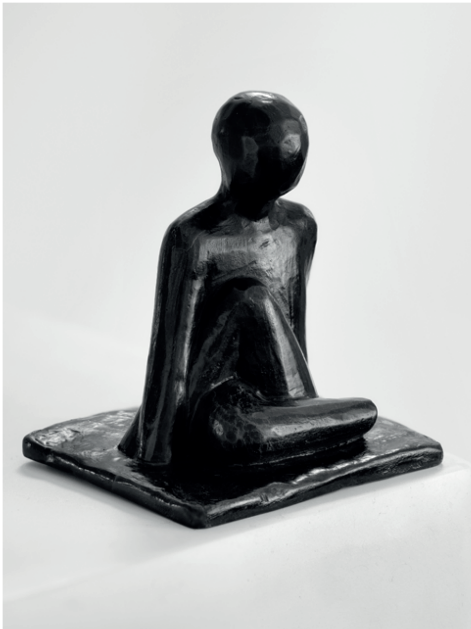
JOGÍN 1999, bronz, 13 × 11 × 9,5 cm