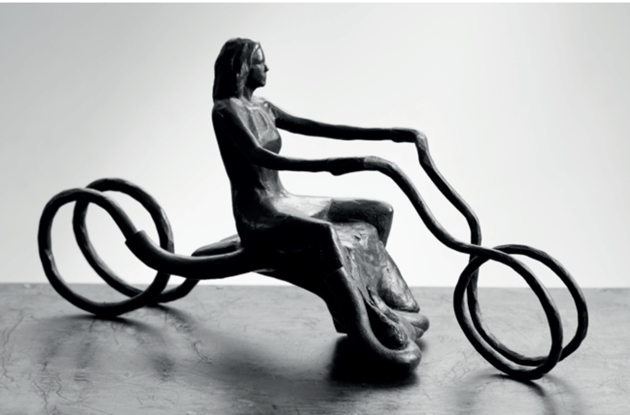
ILUZE 2019 – 2023, bronz, 19 × 35,5 × 11 cm