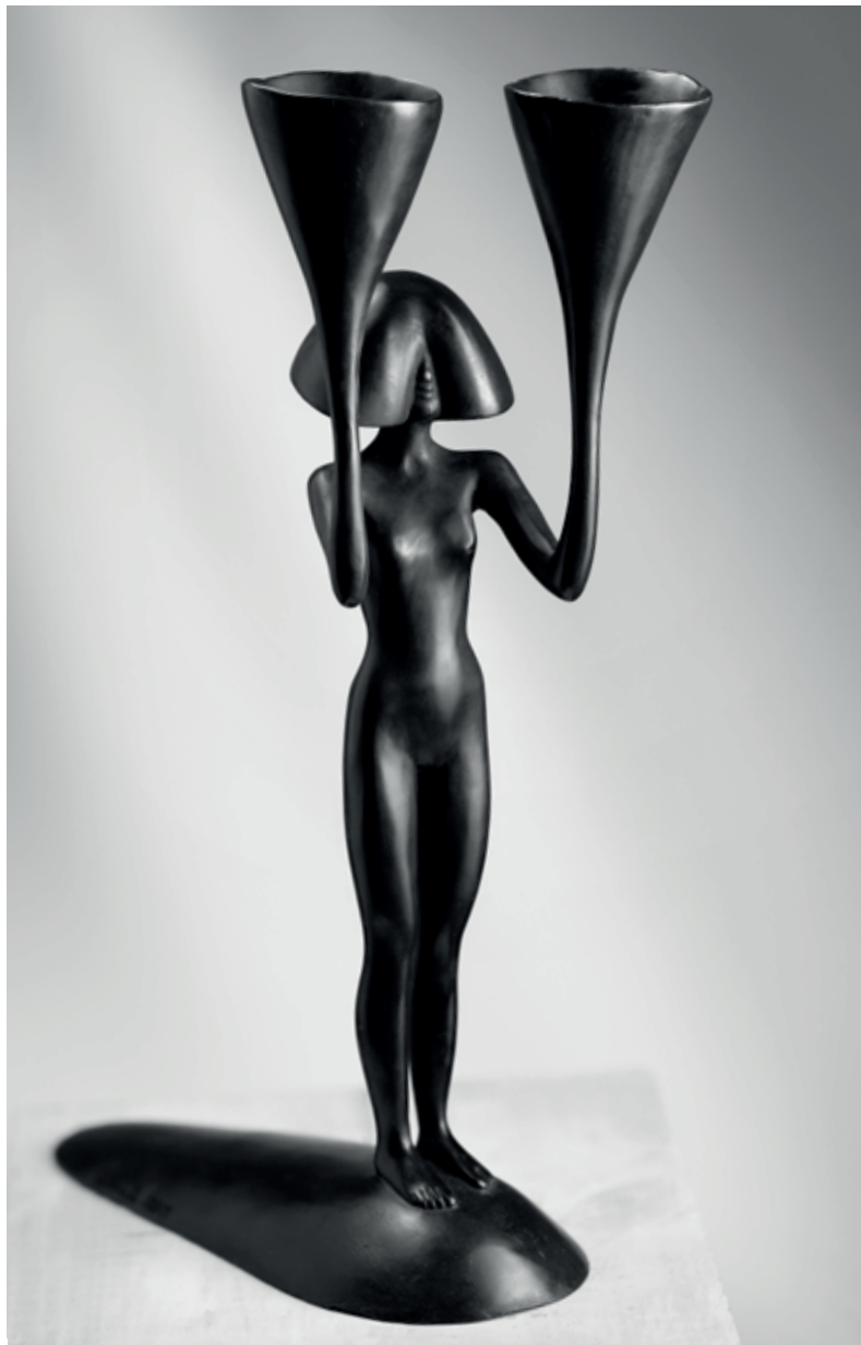
DVA POHÁRY 2001, bronz, 45 × 29 × 14 cm