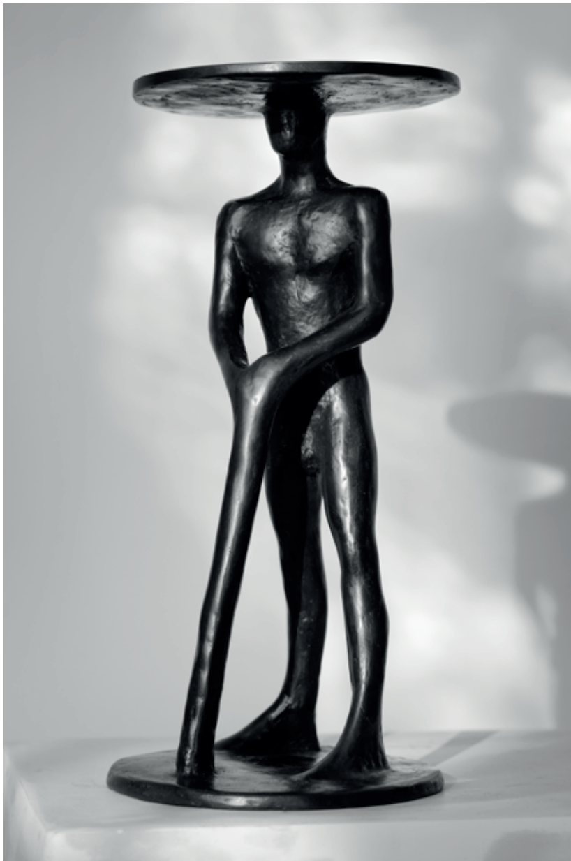
KLOBOUK 2006 – 2022, bronz, 32,5 × 15,5 × 15,5 cm