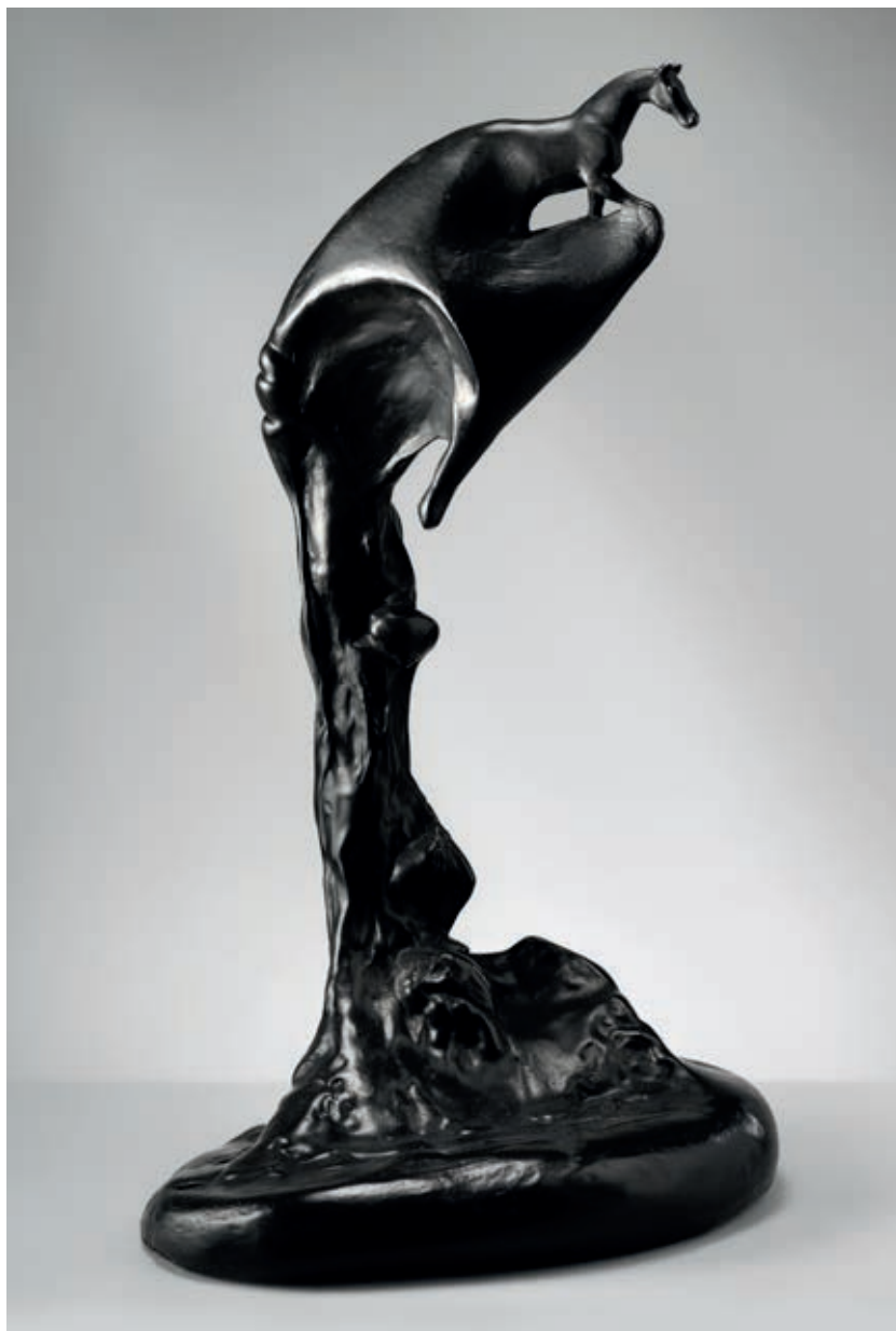
PEGAS 2016, bronz, 38 × 22,5 × 20 cm