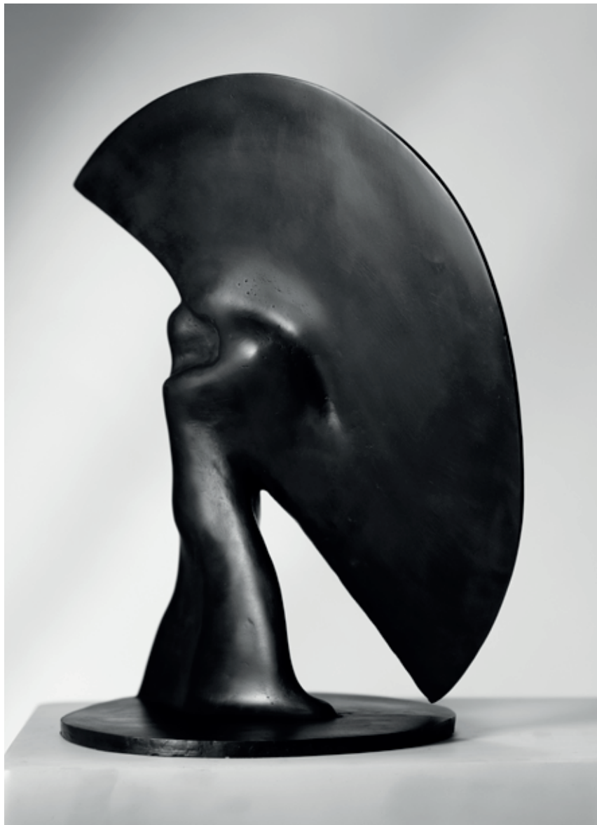
DRÁHA OSTŘÍ 2008, bronz, 36 × 21 × 21 cm