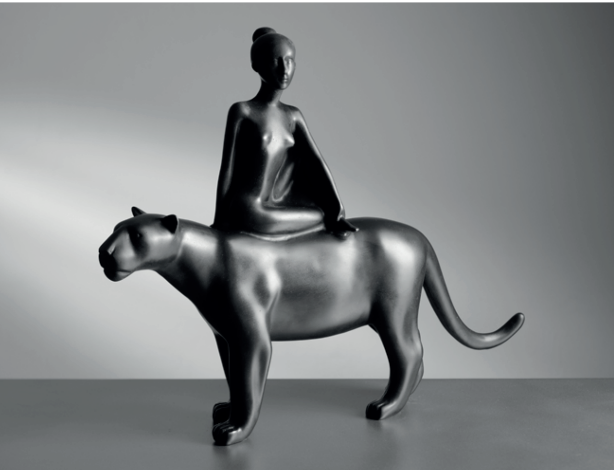
NA VELKÉ KOČCE ZLEVA 2008 – 2021, bronz, 32 × 43 × 9 cm