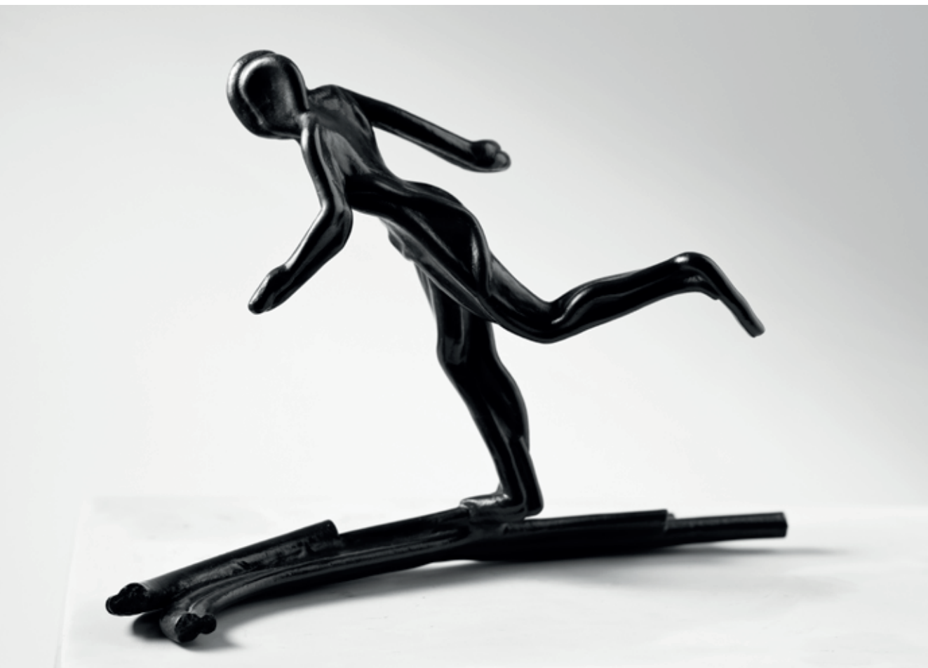
BĚH V LINÍCH III. 2011 – 2022, bronz, 21 × 31,5 × 13 cm