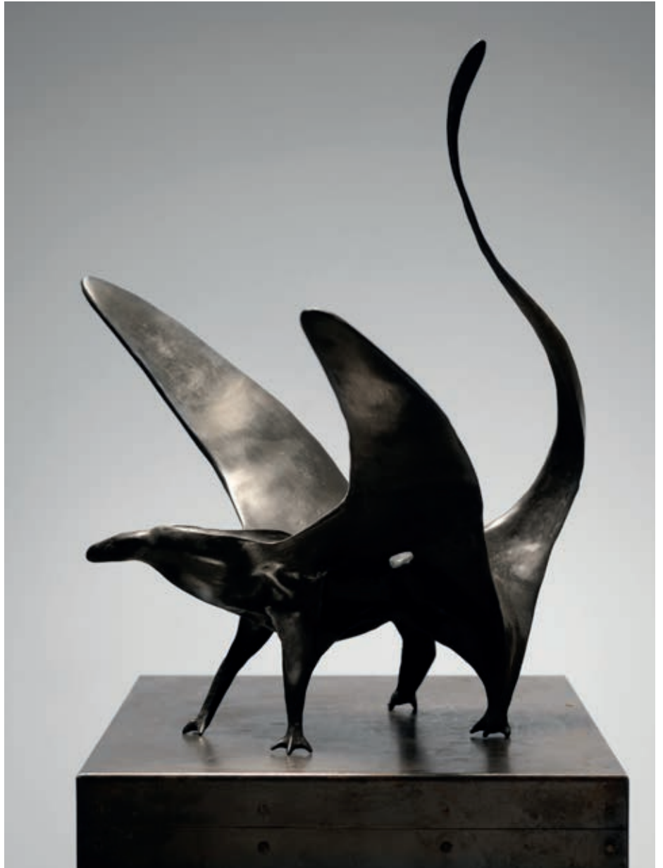
DRAK 2019, bronz, 43 × 30 × 38 cm