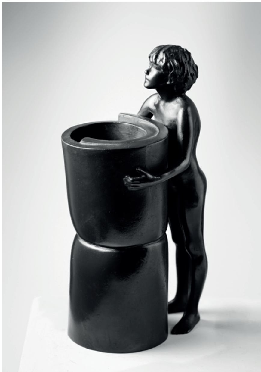
S MOLITANEM 2021, bronz, 25 × 13 × 8 cm