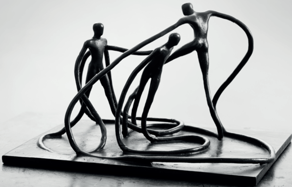
TROJICE 2008, bronz, 14 × 24,5 × 17,5 cm