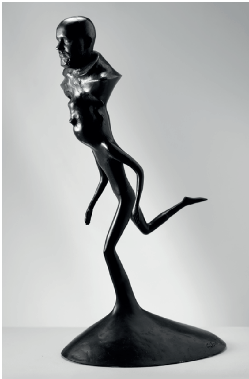
PŘÍZRAK BĚŽCE 2020, bronz, 43,5 × 23,5 × 14 cm