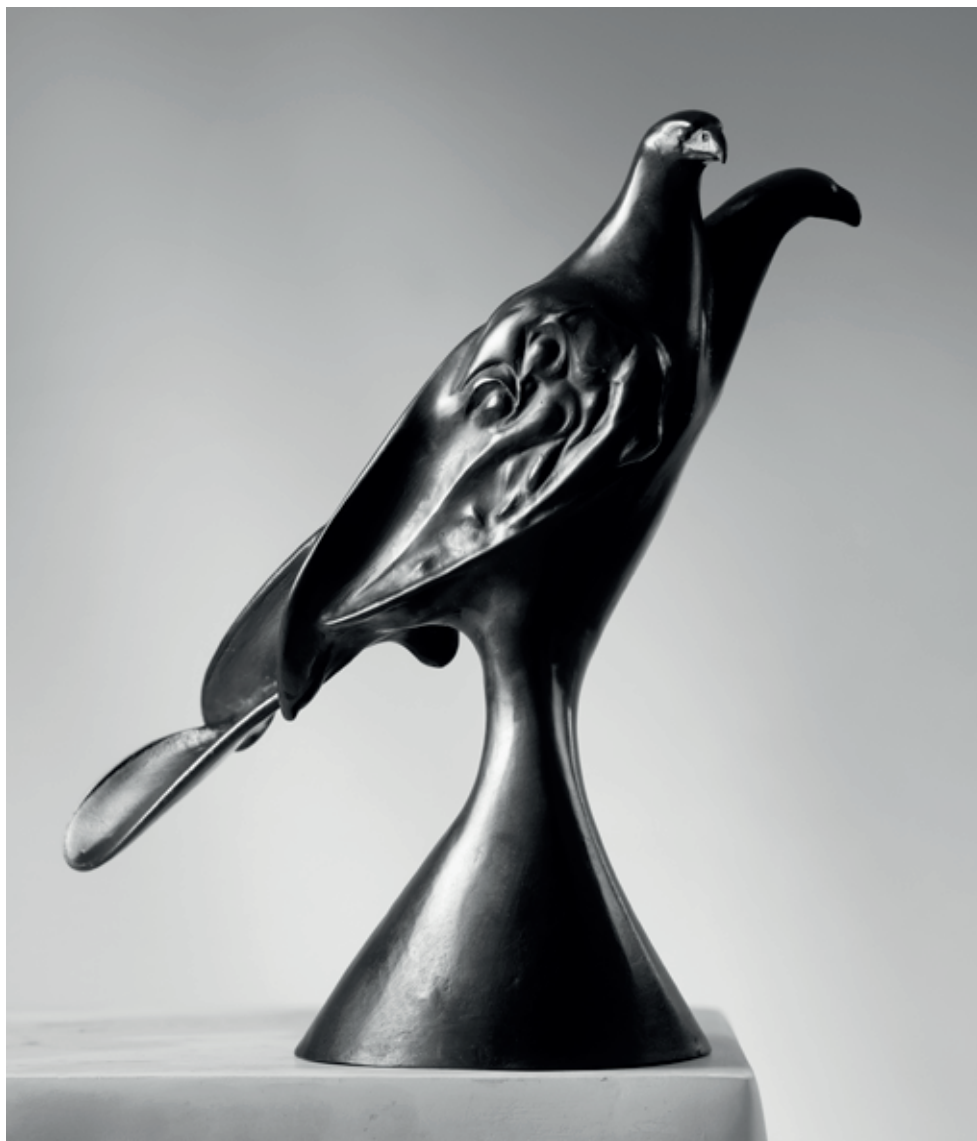
HEJNO DEVÍTI PTÁKŮ 2022, bronz, 26 × 26 × 22 cm