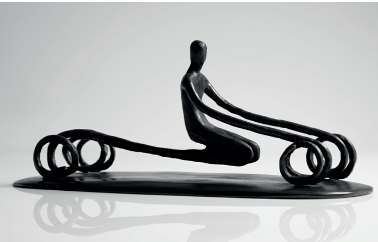
ČTYŘKOLKA 2015, bronz, 14 × 36 × 17 cm