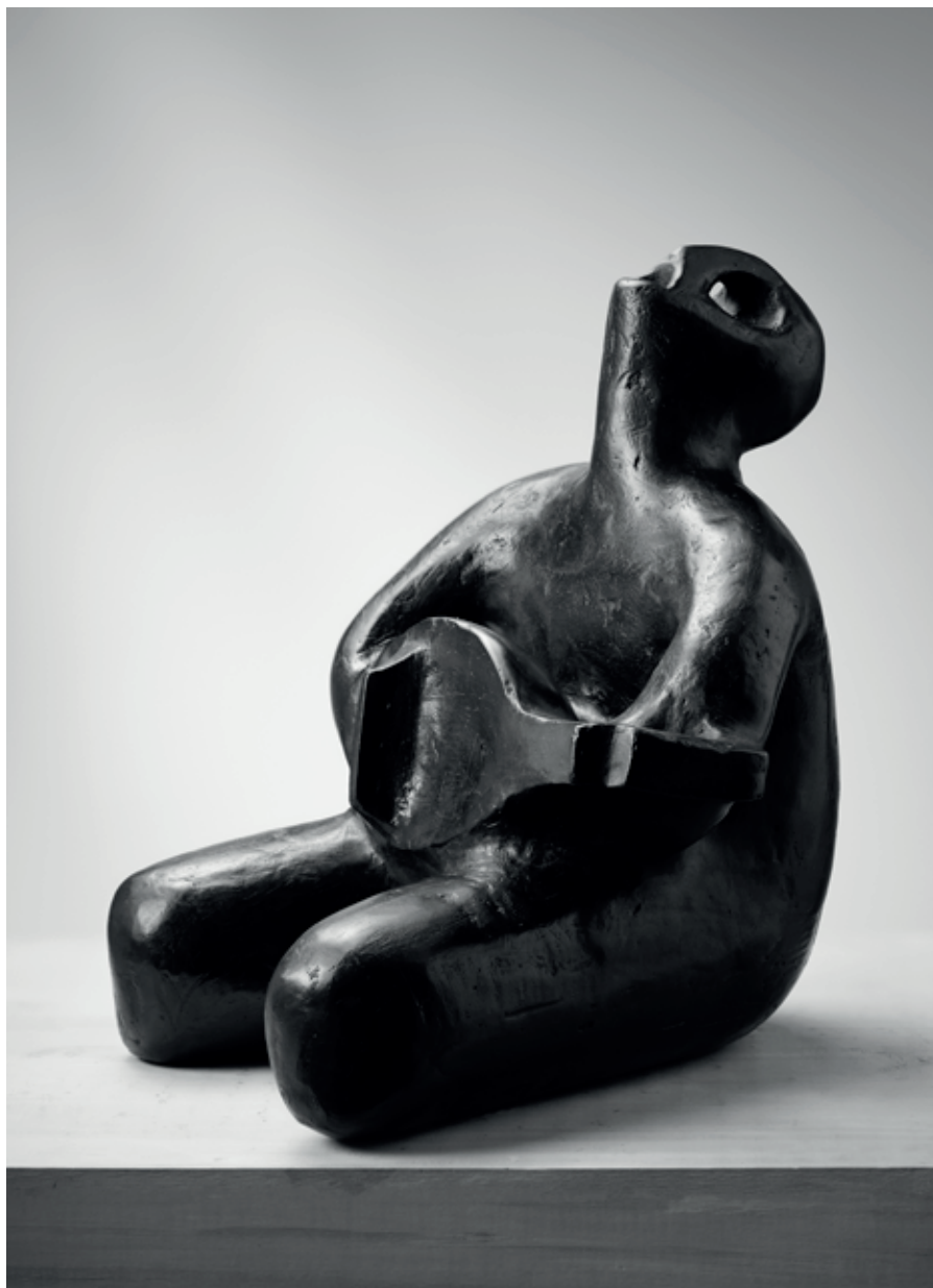
LOUTNISTA ZPĚVÁK 1983, bronz, 25 × 21 × 20 cm