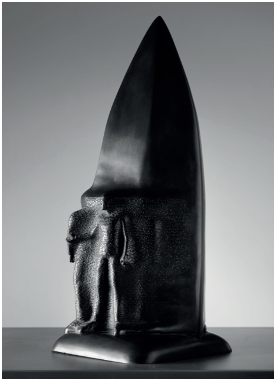
ČEPEL 2008, bronz, 48 × 20 × 20 cm