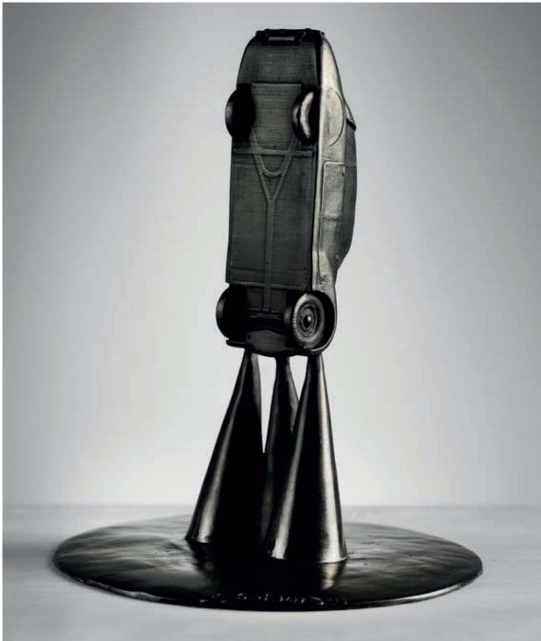
TATRA HANZELKY A ZIKMUNDA 2022, bronz, 27 × 21 × 19,5 cm