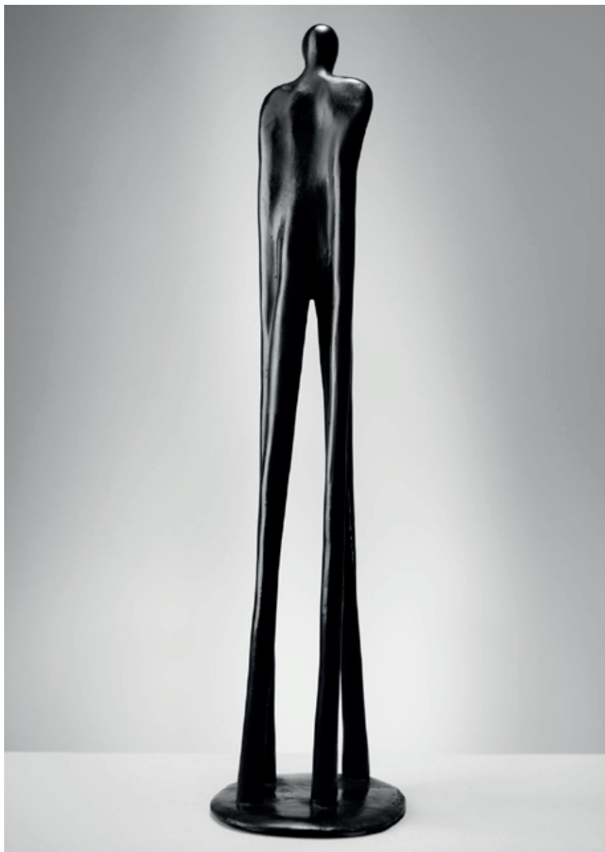
LESNÍ CHODEC 2004, bronz, 43 × 12 × 10 cm