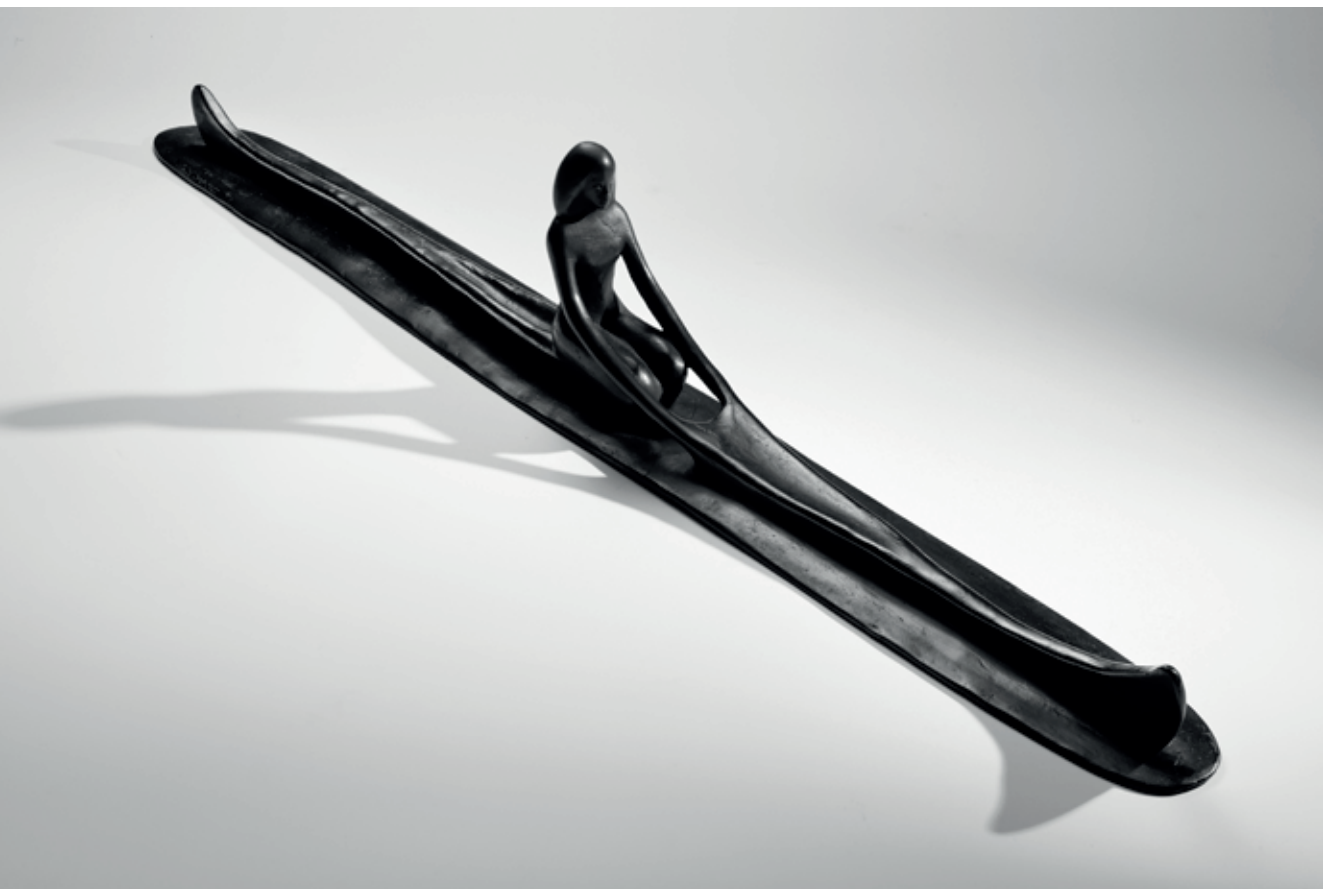
KANOISTKA 2019 – 2022, bronz, 16 × 98 × 9 cm